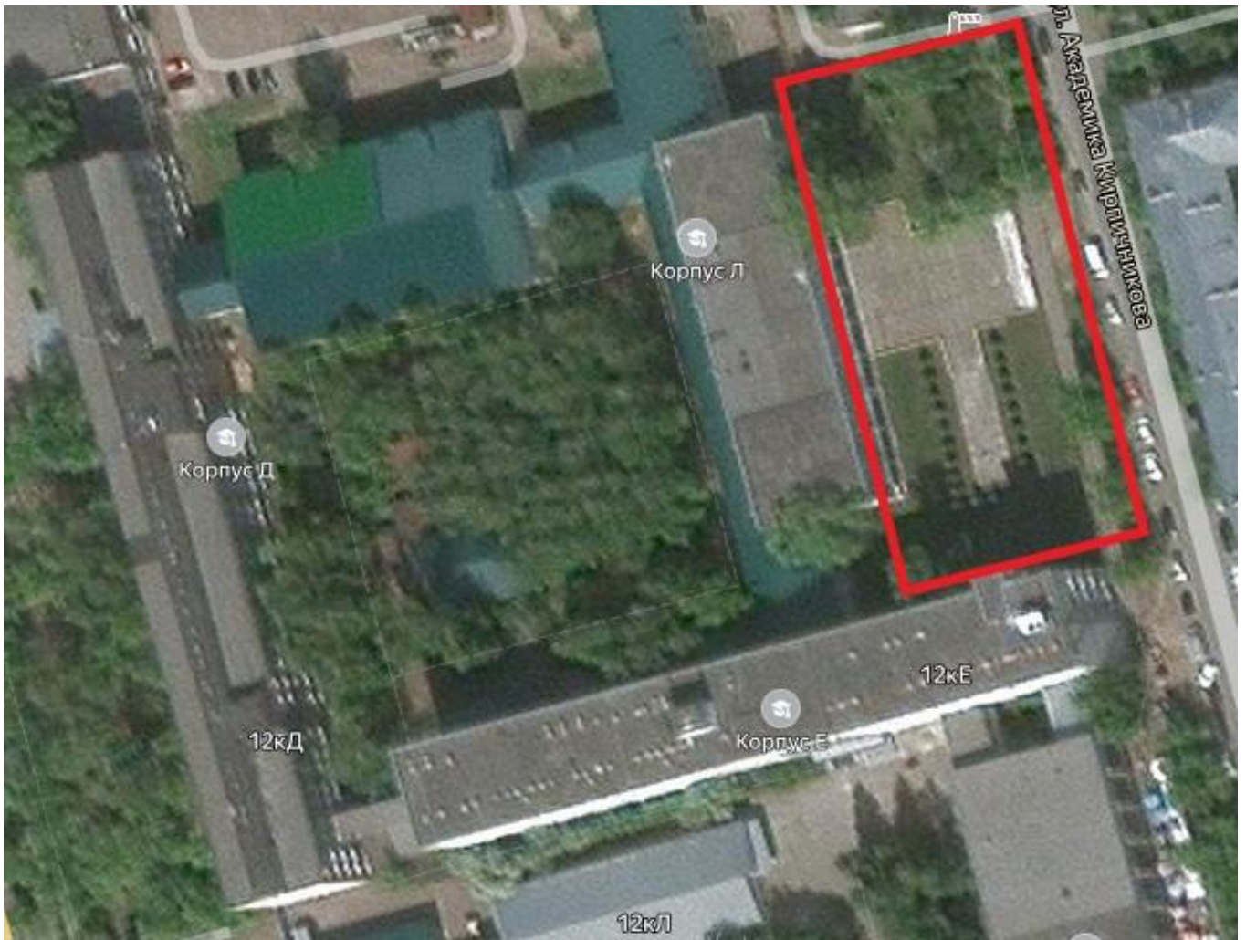
Рисунок 2 - «Спутник» с указанием территории