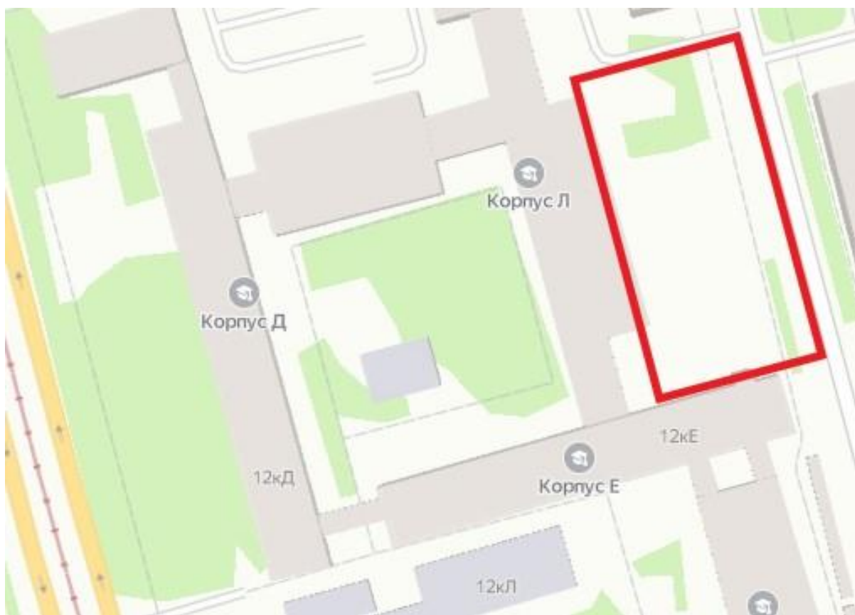
Рисунок 1 - «Схема» общей карты местности

Ниже представлены «схема» (рис.1) и «спутник» (рис.2) карты местности.