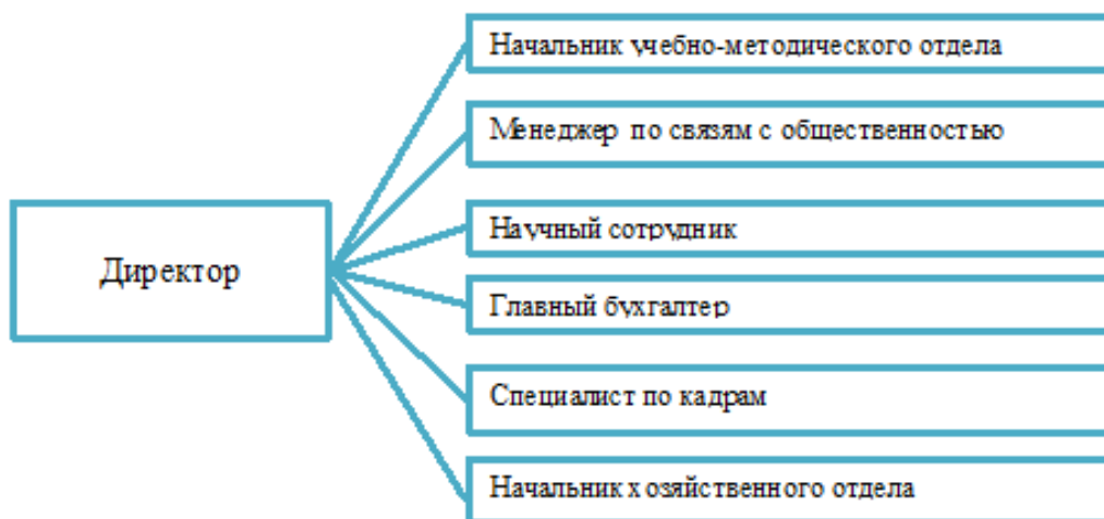
Рисунок 1 - Структура управления БФ ФГБОУ ВО «КНИТУ»

Филиал возглавляет директор. Структура управления представлена на рисунке 1.