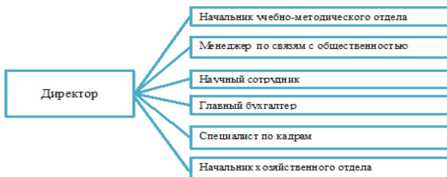
Рис. 1 Структура управления БФ ФГБОУ ВО «КНИТУ»

Филиал возглавляет директор. Структура управления представлена на рис. 1.