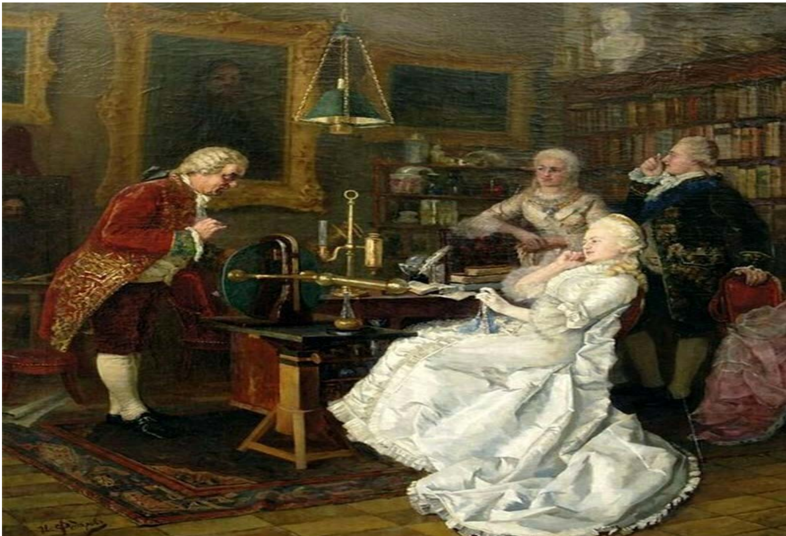
Посещение Михаила Ломоносова императрицей Екатериной II