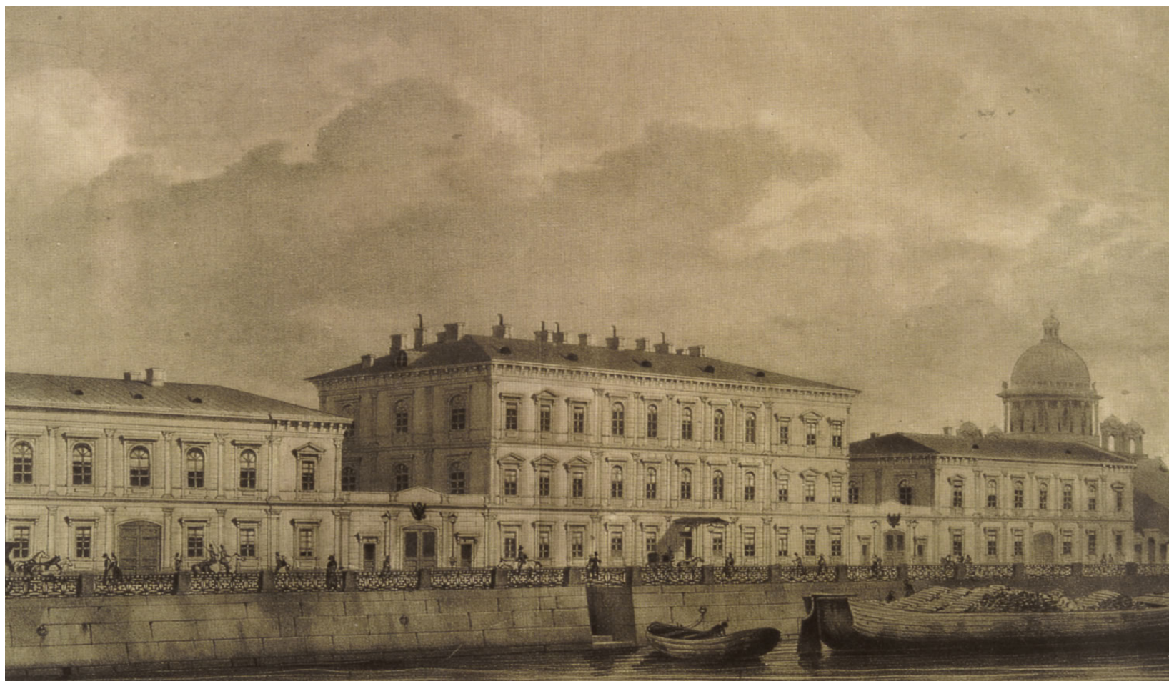
Дом Михаила Ломоносова на реке Мойка, Петербург