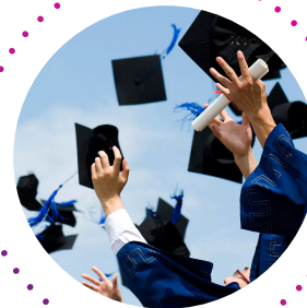
НАУКА И ОБРАЗОВАНИЕ