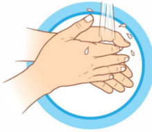
ЧАСТО МОЙТЕ РУКИ С МЫЛОМ