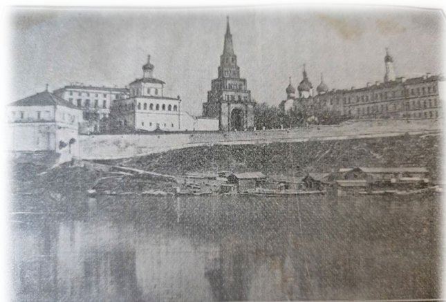
Видъ Казанскаго кремля съ сѣверо-западной стороны.

древнейшей истории края и возникновении Старой Казани, об основании Новой Казани и легендах, связанных с этим событием, так как история Казани, как и история большей части древних городов, окутана пеленою мифов и преданий. В главе о Казанском царстве есть сведения о казанских ханах с указанием имен и дат их правления. В главе «Казанские исторические достопримечательности и памятные события» ведется рассказ о памятниках XVI века: это памятники татарской Казани – городище Иске Казан, Кремль, Ханские дворцы, башня Суюмбеки, исторические урочища города и памятники, построенные после покорения Казани – Благовещенский собор, Зилантов монастырь, Спасская церковь.