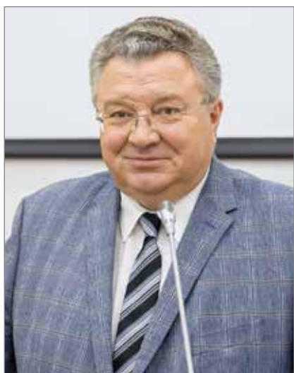
Андрей Иванович Рудской – ректор СПбПУ, академик РАН

Санкт-Петербург, ул. Политехническая, 29 8 (800) 707-18-99 office@spbstu.ru