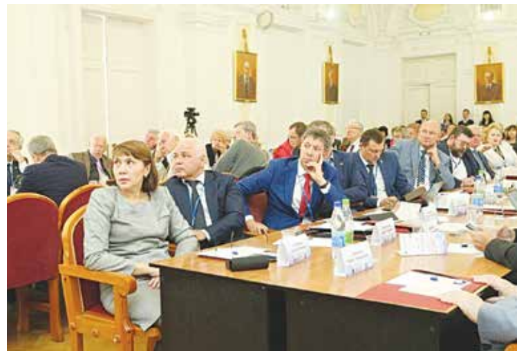
Круглый стол, «Синергия-2018», Казань, КНИТУ