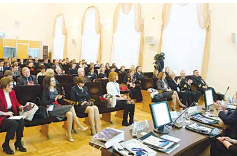
Заключительная сессия «Синергии-2019» в ГУМиРФ им. адм.С.О.Макарова, С.-Петербург