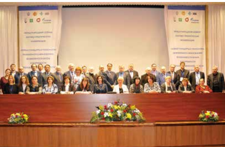
Заключительная сессия конференции «Синергия-2017», Казань, КНИТУ