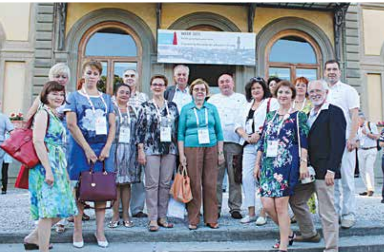
Международная конференция по инженерному образованию IGIP во Флоренции, сентябрь 2015 г.