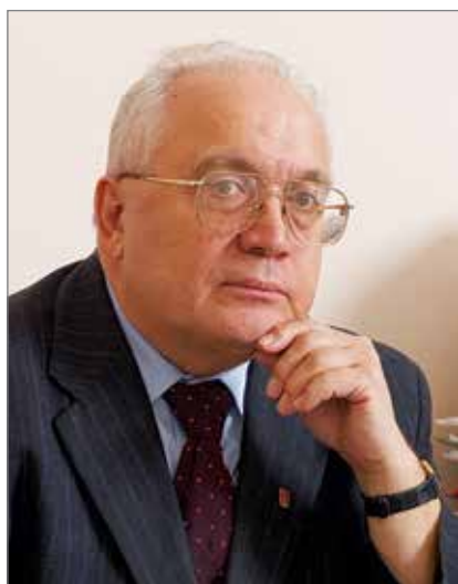
Садовничий Виктор Антонович – ректор, академик, действительный член РАН

Москва, Ленинские горы, 1 +7 (495) 939-10-00 info@rector.msu.ru