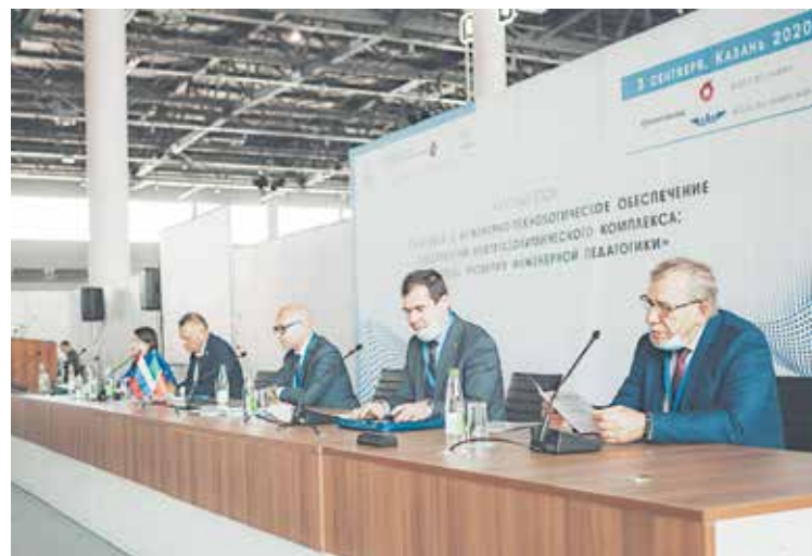
Открытие конференции «Синергия-2020», КНИТУ, 3 сентября 2020 г.