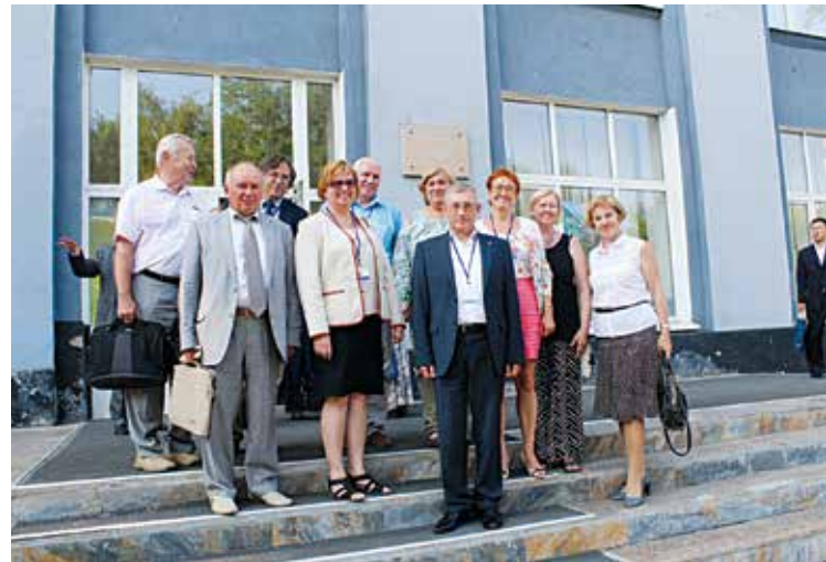
Заключительная сессия конференции «Синергия-2016», Иркутск, ИргТУ